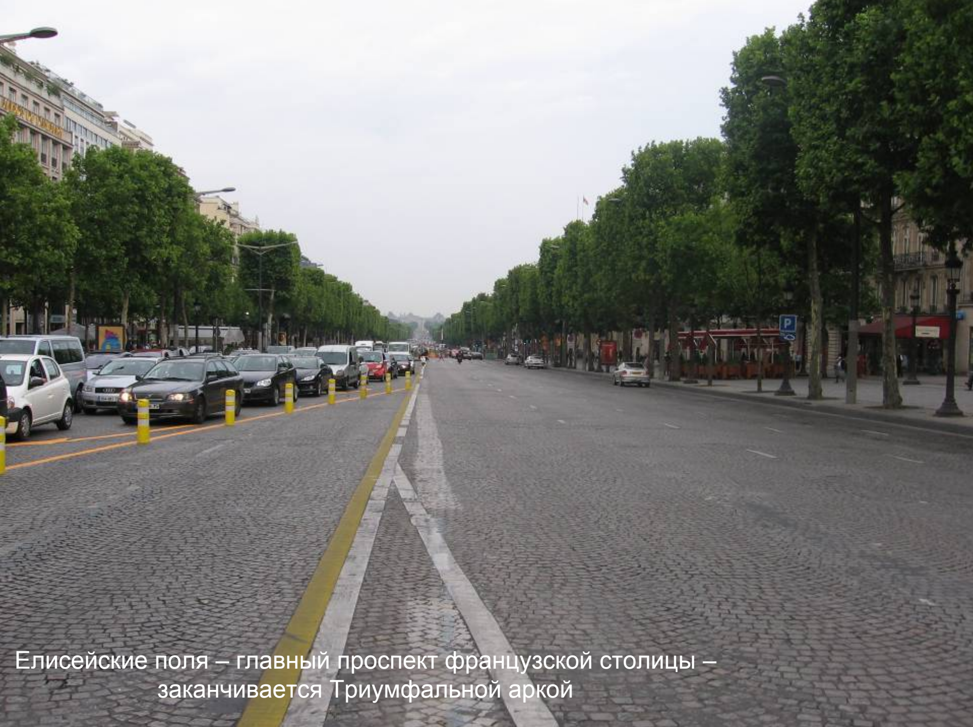
Елисейские поля – главный проспект французской столицы – заканчивается Триумфальной аркой